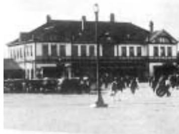
昭和17年当時の函館駅前

今でもはっきり憶えていることがある。昭和20年終戦の年、私は柏野小学校の6年生だった。学校では空襲警報発令の時兄弟が集まって下校する練習をよくやった。私は越境入学していたので、本町の自宅まで一人で帰った。ある時母が学校に呼び出されて、吉岡方面に集団疎開をするのだけれど食糧がない状態なので、出来れば知り合いへ縁故疎開をしてほしいといわれた。結局遠縁にあたる函館から当時の汽車で5時間位の倶知安の近くの目名へ疎開することになった。勉強道具をランドセルに詰めて着替えは母が背負って、市電にも乗らず函館駅まで30分位かかって歩いた。まもなく空襲警報のサイレンが鳴り警防団の人の指図で函館駅前の防空壕へ、みんなが我先にと入った。その時母は私を引っぱって家へ帰ろうと言った。急いで見つからないように家の方へ戻った。私達は市電の線路を走るようにして歩いた。途中何度も警防団のおじさん達に「どこを歩いているのだ、軒下を歩け。」と怒鳴られて家にたどりついた。その日、家から駅の方を見ると飛