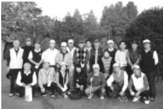
第25回・11月11日・浦和GC

携帯 : 090-1818-8129 メール : y-koba@bc.ij4u.or.jp