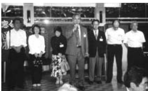
76期が次回大会へ決意表明

なお、参加者には、北海道製菓(本社・函館)より寄贈されたクッキーとカンパセットがお土産としてプレゼントされた。