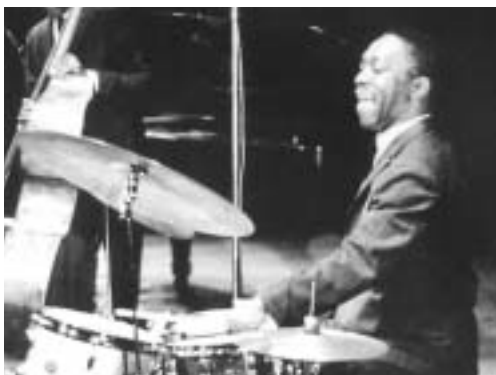
アート・ブレイキー

と、突然雷が轟き、火山が爆発し、 ナイアガラの滝が出現したかのよ うな、とにかくとてつもなくスケ ールの大きいドラムの音がうなり を上げて鳴り出した。デイズ・ ガレスピー作 チュニジアの夜 のイントロが始まったのだ。ホー