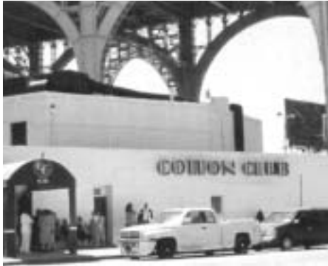
コットン・クラブ

りを務める人)だった。メンパーは皆ベテランのツワモノ揃いでかなり緊張させられた。その後も、エキストラとして何度か仕事をした。1999年1月、クラブのオーナーから「君にはもう電話をしないよ。」と言われ、一瞬何のことだろうと考えたが、それは私をレギュラーとして雇うという意味であった。黒人のエンターティナーのみが出演するのが原則のコットンクラブでは異例のことだった。こうして私はハウスピアニストになった。同時に毎週月曜日がスウィングダンスナイトとなり、ビッグバンド(コットンクラブ・オーケストラ)の演奏も始まった。クリエイティブなジャズを演奏する場ではないが、伝統的なジャズ・ブルース、リズム・アンド・ブルース、ゴスペルなど、日本で生まれ育った私がじかに接することがなかった音楽に接し、演奏することができると同時に、私にとって、仕事場であると同時に、多くを学ぶ場所となった。そして、自分のキーボード類を持ち込み、ピアノの周りに