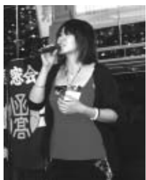
音音(99期・平成9年卒)

はためく峰も……を全員で合唱。高校時代に思いを馳せ、次回の再会を約束して懇親パーティを終了した。