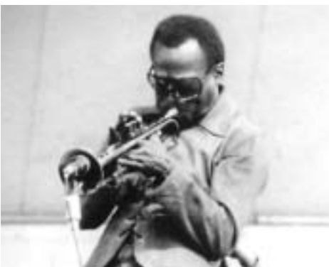
マイルス・デビス

その夜、私は最後まで演奏に参加した。終わって外を見ると、いつの間にか雪が降り始めていた。ニューヨークで初めて見る雪だった。とても幸せだった。恐怖心はもうなかった。