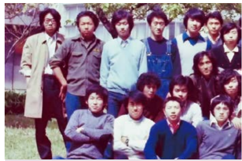
函中時代 後列左端 学友と