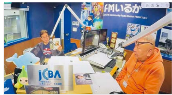
HAKODATE 街角ラジオ FM いるかで自作を語る