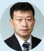
北海道函館中部高等学校 第41代校長