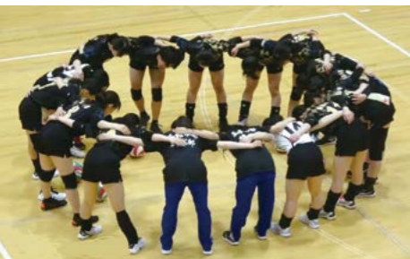
30年ぶりの全道大会進出を果たしたバレーボール部

バレーボール部、卓球部、バドミントン部、剣道部、弓道部、囲碁・将棋部、放送局、書道部、LMC(軽音楽部)、水泳、ソフトテニスなど昨年度以上に数多くの部活動が全道大会への出場を果たし、函中部活動の健闘が光っています。今年度もぜひ多くの部活動が全道大会へ進出する活躍をみせることを大いに期待しています。