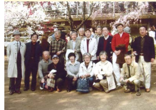
左：新宿御苑での花見