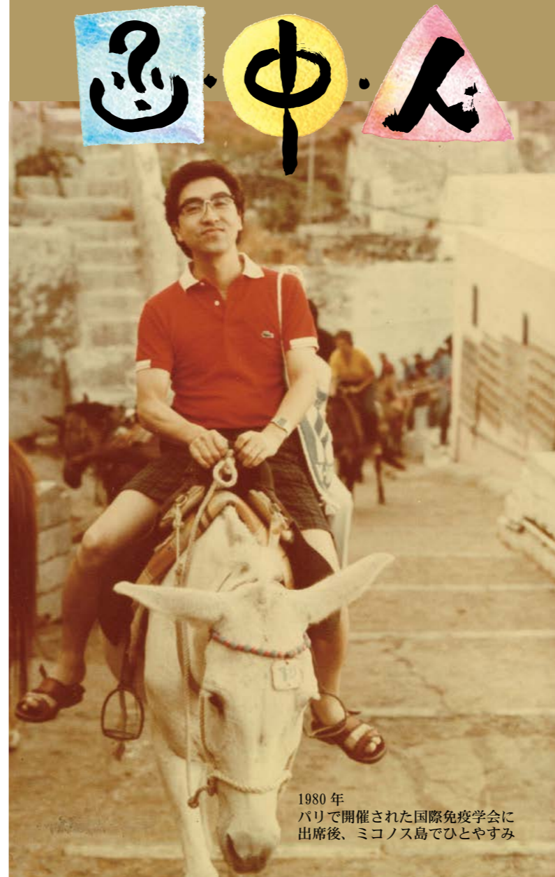
1980年 パリで開催された国際免疫学会に 出席後、ミコノス島でひとやすみ