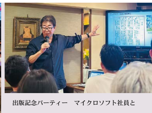
出版記念パーティー マイクロソフト社員と

のですが、地元では中々雇用されないことがあり、この大学の良さに気づいていない方も多いのではないのでしょうか。