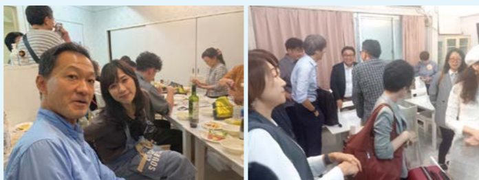
大いに盛り上がりました♪