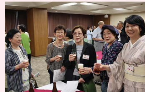
★2024年5月東京さつき会スナップ写真★

函中72期東京同期会(東京さつき会) (広告協賛) 渡部総合法律事務所 新宿御苑前 電話03-3355-5415(代)