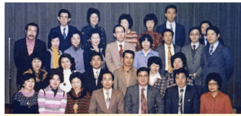
第一回同期会 (47年前、昭和52年、西暦1977年)