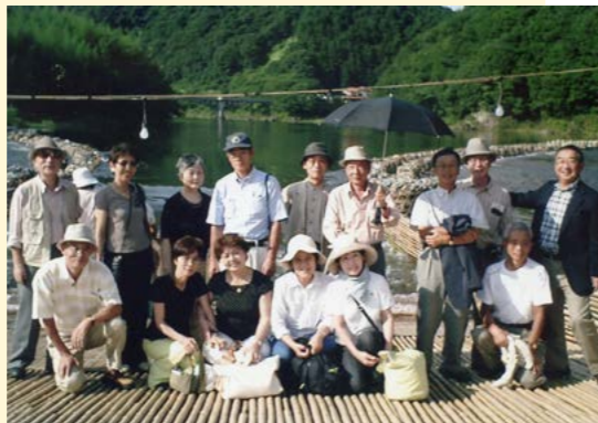
右：栃木県那珂川のやな